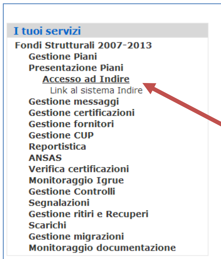
Fig. 4 Link per Accesso al sistema Gpu